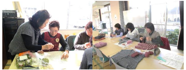
* 冬の編み物教室 *