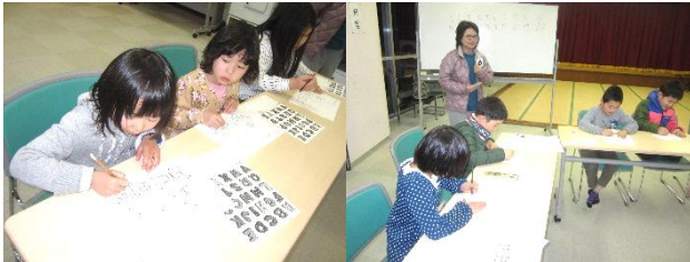
* 英語教室 *