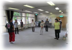
元気ハツラツ教室