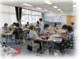
パッチワーク教室