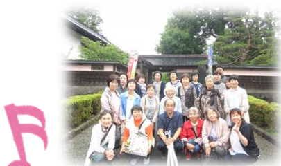
趣味の教室移動研修